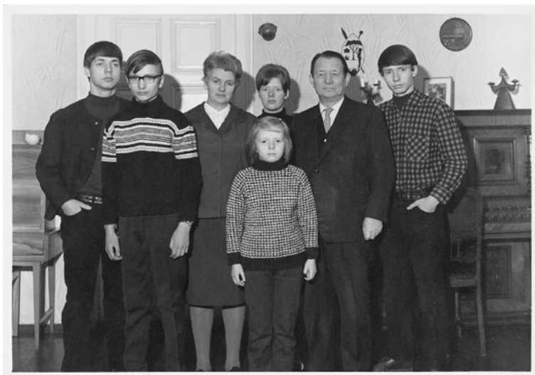
2. Rodzina Meckelów w Domu Misyjnym, 1968.

W 1959 r. ojciec ponownie zmienił miejsce pracy i został inspektorem w Misji Berlińskiej. Dom Misyjny, dziś będący siedzibą biskupa, znajduje się na Georgenkirchstraße przy berlińskiej Bramie Królewskiej, niedaleko Alexanderplatz. Tam już mogła przeprowadzić się cała nasza rodzina i tutaj w 1959 r. poszedłem do szkoły.