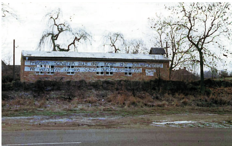
7. „Stworzyć pokój z siły słabych – rezygnujemy z ochrony nuklearnej”. Transparent na barakach kościelnych w Vietzen, jesień 1983.

Jesienią 1983 r. zrobiliśmy ze starych prześcieradeł duże transparenty, wypisaliśmy na nich: „Stworzyć pokój z siły słabych – rezygnujemy z ochrony nuklearnej”, i przytwierdziliśmy je na baraku kościelnym w Vietzen, gdyż codziennie przejeżdżały tamtędy autobusy ze stoczni, wiozące po kilkuset robotników. Przynajmniej oni powinni choć raz zobaczyć te napisy, bo oczywiście spodziewaliśmy się, że będą wisiały tylko kilka godzin. Ale jakimś cudem wisiały przez trzy dni.