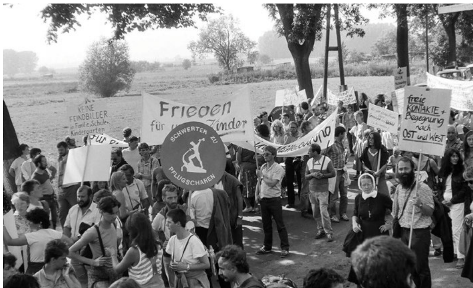
12. Marsz upamiętniający Olofa Palmego, 1987.

tanii, Austrii i Szwecji. Atmosferę zdominowała ogólna euforia. Nigdy jeszcze nie doświadczyliśmy, by bez przeszkód publicznie móc głosić swoje hasła. Znaczna część uczestników wywodziła się z oficjalnych organizacji społecznych. Początkowo szli oddzielnie, ale powoli uczestnicy zaczęli się mieszać. Wkrótce nasze hasła zdominowały marsz, choć później pojawiły się też inne. Marsz był dla wielu osób wspaniałym i dającym nadzieję wydarzeniem. W tamtym czasie z pewnością połączyło się wiele różnych interesów, by umożliwić to spotkanie, którego obraz był niezwykle różnorodny. Było też wiele wątpliwych rzeczy, które mi się nie podobały. Ale właśnie tej różnorodności i odmienności nie było w żadnym innym miejscu w NRD, a więc doświadczenie było niezwykle. Miało się ono powtórzyć i rozwinąć dopiero w 1989 r. Oczywiście nie należy zapominać, że Honecker mógł wykorzystać takie doświadczenia i zdjęcia z marszu na krótko przed swoją wizytą w RFN. Ale niezależnie od tego były one rzeczywistością.