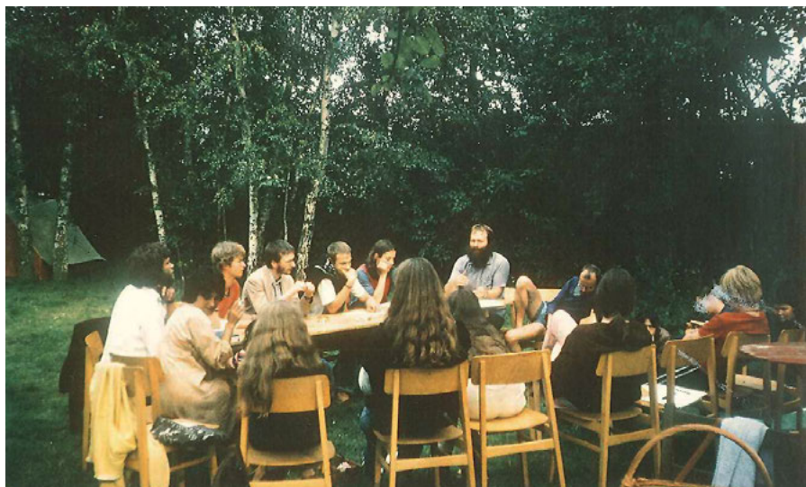
11. Seminarium pokojowe, 1986.