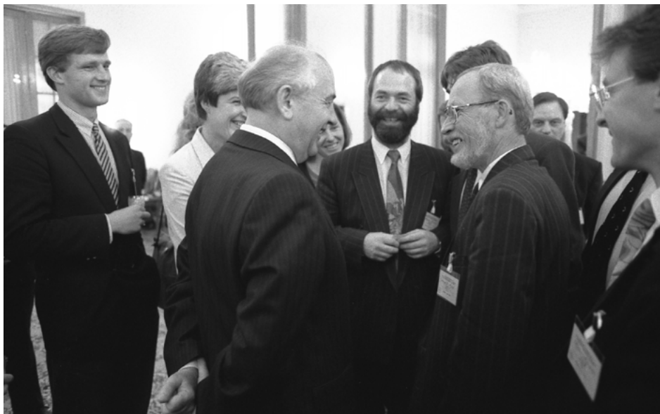
19. Markus Meckel, Michail Gorbaczow i Lothar de Maizière w Moskwie, czerwiec 1990.

premier zasiadał Tadeusz Mazowiecki, chociaż ze względu na szczególną konstrukcję ustroju w Polsce głos zabierał prezydent Wojciech Jaruzelski, a wraz z nim Václav Havel, Alexander Dubczek 11 , József Antall, Ion Iliescu 12 i Lothar de Maizière. Przedmiotem dyskusji była przyszłość samego sojuszu. Václav Havel wyraził to jasno: czy układ ma zostać rozwiązany, czy też zasadniczo zmieniony? 13 Czołowa rola Związku Radzieckiego w dotychczasowej formie nie znajdowała już akceptacji. Każde państwo miało swoją własną agendę. Państwa Europy Środkowej, które zdemokratyzowały się w wyniku wyborów, ustaliły poprzedniego dnia wieczorem z inicjatywy Węgier wspólną linię postępowania. Gorbaczow wygłosił długie przemówienie, mówił o swoich niedawnych spotkaniach z prezydentem