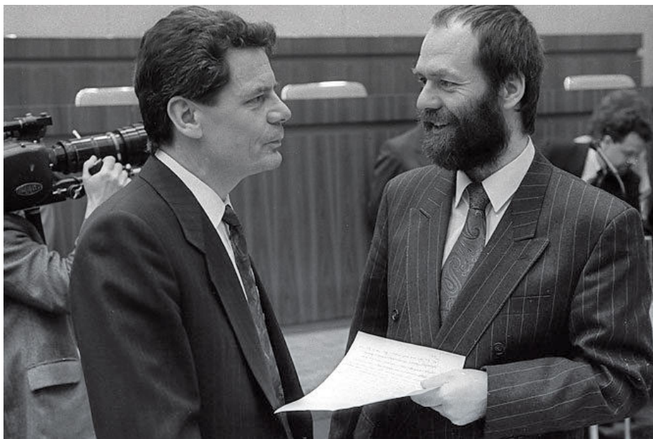
17. Markus Meckel i Joachim Gauck w dniu zaprzysiężenia ministrów pierwszego demokratycznie wybranego rządu NRD przed Izbą Ludową, 12 kwietnia 1990 r.