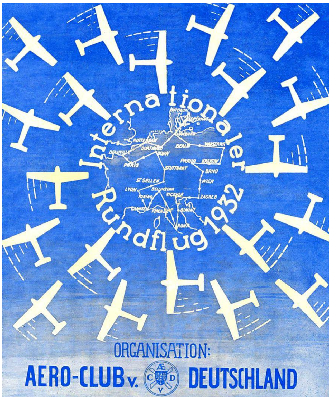
Okladka broszury z programem Challenge International 1932