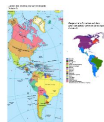
Zał. 1.1, Języki w Ameryce

Impuls: „Określcie z jakiego kontynentu pochodzą języki, którymi ludzie posługują się w Ameryce”. Uczniowie zastanawiają się, dlaczego tak się stało i formułują pierwsze przypuszczenia, dlaczego na tej mapie pojawiły się europejskie języki.