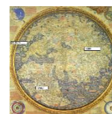
Zał. 1.4, średniowieczna mapa świata

Uczniowie czytają akapit „Handel między Europą a Azją” na s. 26, dostarczający ogólnej wiedzy o przyczynach „odkryć” geograficznych.